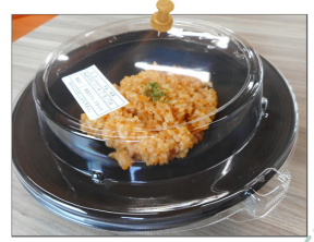
キムチ風ピリ辛チャーハン …400円