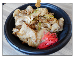
豚 丼 …450円