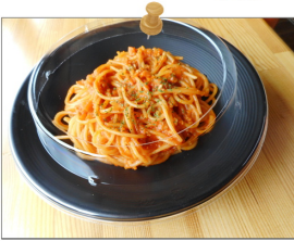
西口ナポリタン …650円